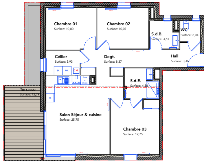
Plan de Propriété